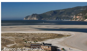
Banco do Cambalhão

Contactos úteis GNR Tróia | 265 499 610 Central de Segurança troiaresort | 265 499 250 Posto Médico | 933 338 932 Recepção troiaresort | 265 105 500